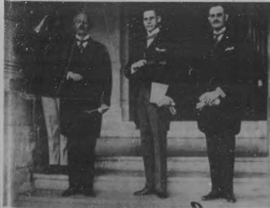
EL NUEVO MINISTRO DE AUSTRIA. —Dos aspectos de la presentación de credenciales del Excmo. Sr. Edgar Procházka, nuevo Ministro de Austria en Cuba, acto celebrado el jueves, con el ceremonial de costumbre en el Palacio Presidencial.

El señor Zamora salió altamente satisfecho de su visita y de los agasajos recibidos en Baracoa, y dispuesto a ayudar a sus vecinos y huéspedes en el progreso de las Comunicaciones, para