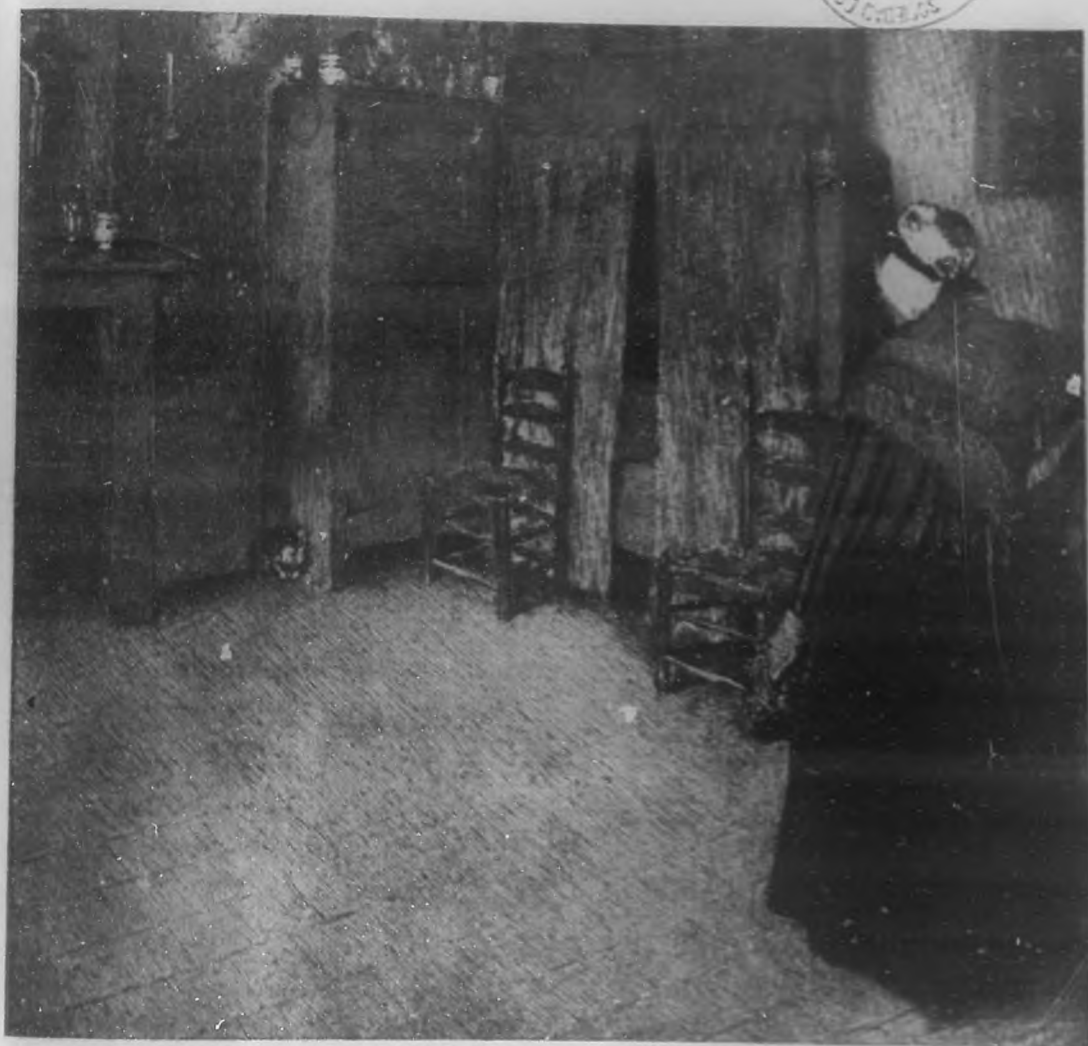
EL DESAYUNO DEL MINERO