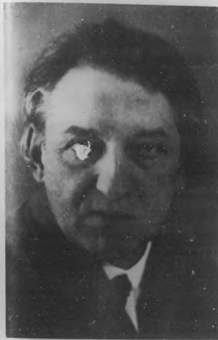
Ultimo retrato de Enrique Gómez Carrillo, el exquisito cronista, gloria de la literatura latino-americana.

Naturalmente, hice hiperbólicos elogios de mi tierra, de sus progresos materiales, de sus escuelas, de sus intelectuales. Hablé del Canal, le disparé una flecha a los yanquis, describí horas de mi pasada bohemia juvenil: en fin, creí un deber recordar con cariño, como sé sentirlo, todo lo que es de mi pequeño, pero bien civilizado país, tan desconocido y tan calumniado en el mundo. Entonces, Gómez Carrillo hizo amables remembranzas de una corta, pero agradable permanencia que hizo en mi ciudad natal, donde estuvo hospedado en una "casa que quedaba cerca del panteón chino". Reconoció en silencio la potencialidad de su memoria. Inquirió algo sobre el actual Presidente, doctor don Rodolfo Chiari, ascendido al solio de la Primera Magistratura en octubre del pasado año. Me exployé en noticias sobre este integérrimo y popular istmeño, al cual me liga un afecto sincero y una amistad profunda. Después hizo recuerdos del ex-Presidente Dr. Belisario Porras, por quien guarda dilecta y vieja estimación. En este sentir, comulgamos en opinión respecto a este notabilísimo caudillo liberal.