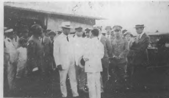
EL GENERAL MACHADO EN ISLA DE PINOS. —El honorable señor Presidente de la República durante su visita a la Jefatura de Sanidad de la Isla, hablando con el jefe de la misma, el competente funcionario doctor José Sagás.

Desde que se hizo cargo del Poder, el general Calles hara apenas un año escaso, no ha omitido esfuerzos ni sacrificios para colocar a su patria a envidiable altura. Su primera obra de Gobierno fué sanear la hacienda pública y con las grandes economías realizadas, que sumaron algunos millones de pesos, fundar el Banco Único de Emisión que era una de las necesidades sentidas por el país para impulsar los negocios. La instrucción pública también ha recibido gran impulso, como las sabias leyes agrarias que estaban en vigor desde pasadas administraciones, hacen dose más efectivas actualmente, con el fin de acabar con los monopolios y grandes latifundios para favorecer al campesino y dotar al indio, al autóctono dueño del suelo, de un pedazo de tierra de cultivos. También nos es grato recordar el incidente surgido hace poco entre la Secretaría de Estado de Washington y el Gobierno de México, con motivo de las declaraciones improcedentes e injustas del Secretario Ke-