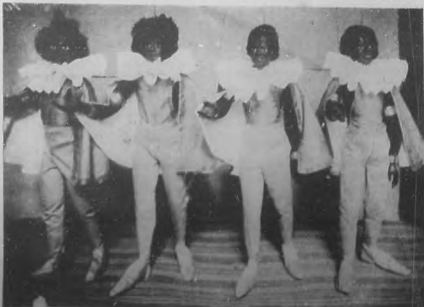
Una de las escenas más interesantes del Teatro de los Chicos, que próximamente inaugura.

La genial artista mexicana, ídolo del público habanero, que mañana lunes arribará a nuestras playas, de paso para Europa.