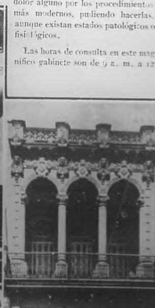
Fachada de la casa Prado número 76, donde el doctor Pérez Palmero tiene instalado su magnífico consultorio.