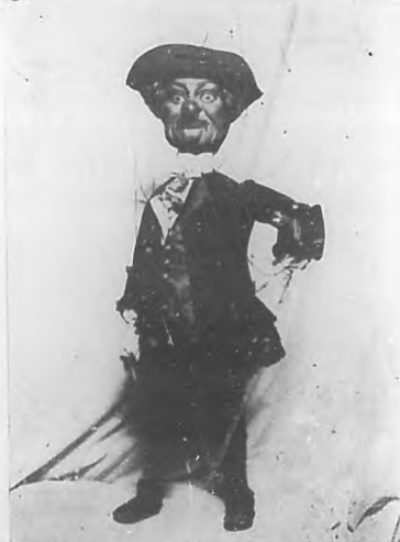
Otra de las figuras que presenta el profesor Podrecca en el "Teatro de los Chicos".

Esperanza Iris, la artista inolvidable, en la Habana.