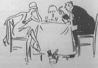
En el Cabaret.