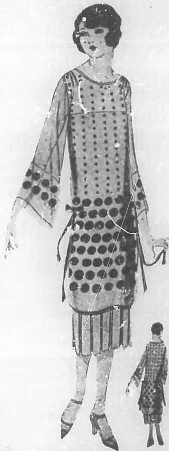
Lindo modelo, de seda crepé con estampados. Muy propio de media estación.