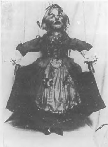
Una de las figuras más simpáticas del "Teatro de los Chicos".